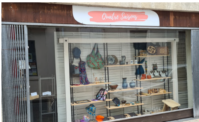
La Boutique des 4 saisons